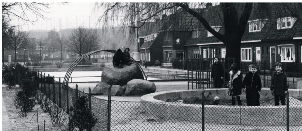
De keien op de kinderspeelplaats aan de Jan van der Heijdenstraat, circa 1958.

Maar de gemeente had buiten de bewoners van de Jan van der Heijdenstraat gerekend. Onder aanvoering van een oud-medewerker van de dienst Publieke werken kwamen die in het geweer tegen de verplaatsing