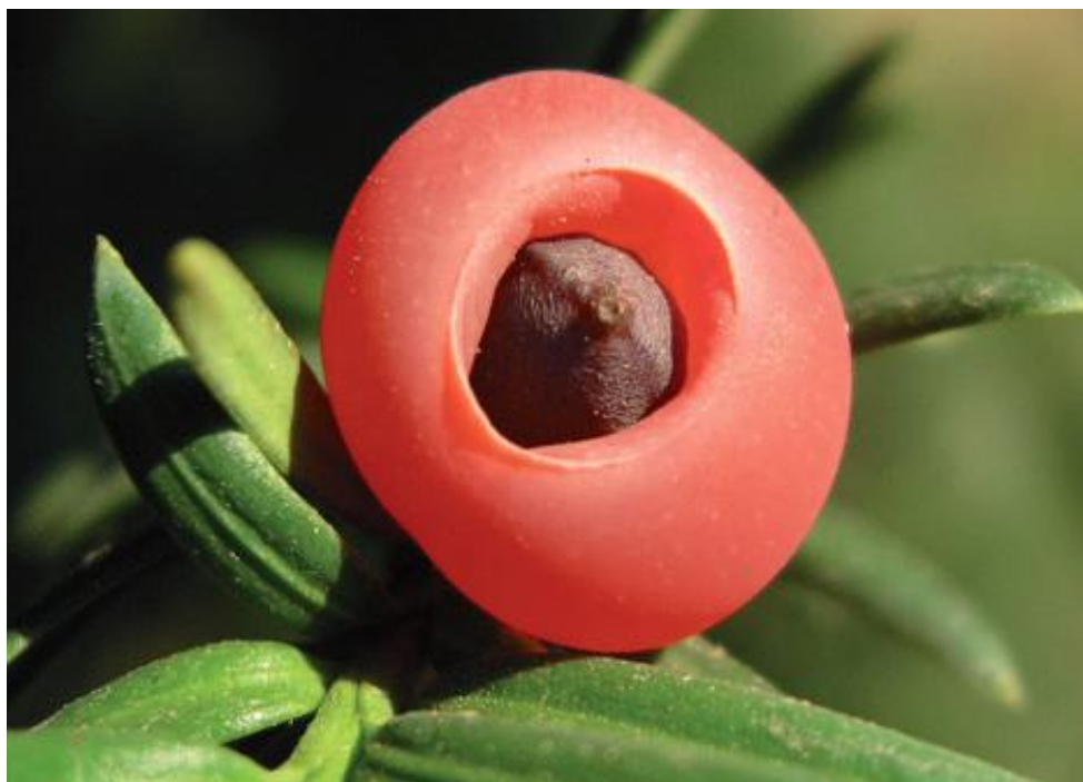
De felrode sappige kegelbessen van de Taxus baccata bevatten veel suikers en vitamine C.

kennis geeft de mens een belangrijk voordeel ten opzichte van andere vruchten- en noteneters, maar heeft ook zo zijn keerzijde, zowel voor plant als mens. De plant heeft geen baat bij het aanbieden van andere delen dan vruchten en zaden en zal zich proberen te verdedigen tegen ongewenste vraat. De mens loopt bij haar exploraties naar nieuwe voedingsstoffen of medicijnen het risico van vergiftiging of zelfs de dood. We geven een inkijkje in het verbazingwekkende gebruik van onze inheemse coniferen door de mens.