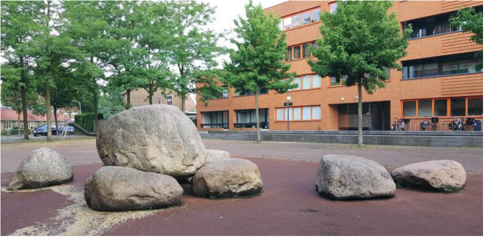
De groep keien zoals die thans ligt op het Ooievaarsplein.