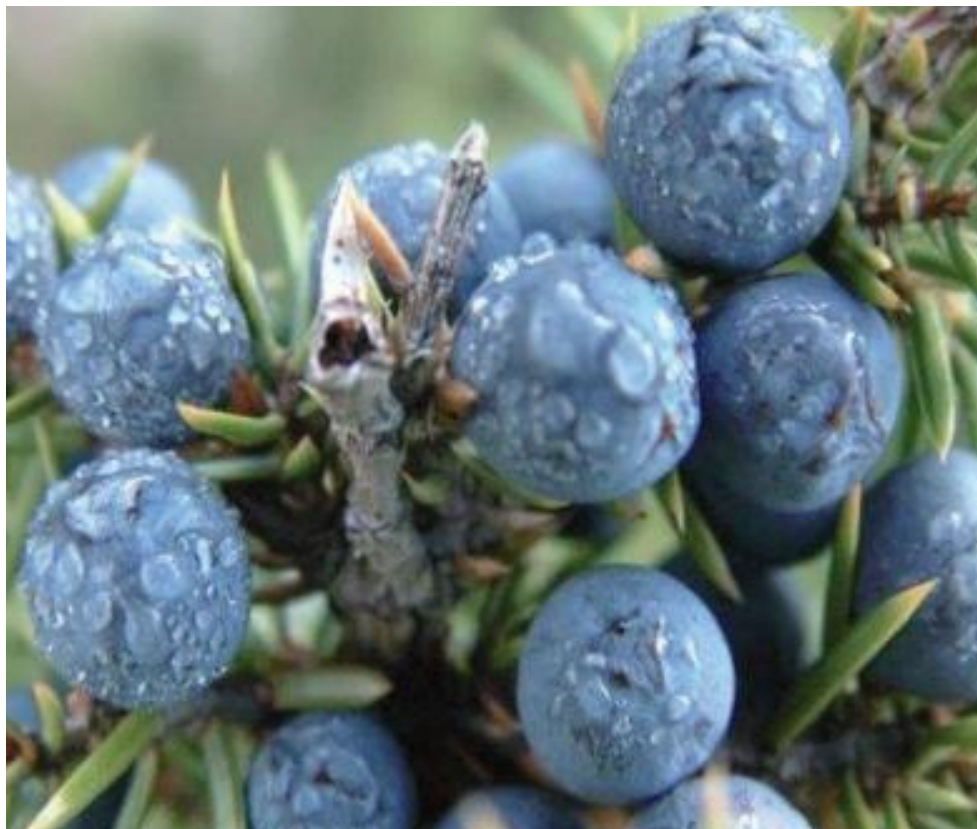
Rijpe blauwe kegelbessen van de jeneverbes (Juniperus communis)

de gewone jeneverbes ( Juniperus communis ) smaakmaker van vele gerechten en natuurlijk onze onvolprezen volksdrank: de jenever. De blaadjes van de gewone jeneverbes zijn weliswaar niet giftig maar wel venijnig stekelig, hetgeen de plant ook beschermt tegen vraat. Andere jeneverbessoorten, zoals de Virginische jeneverbes ( Juniperus virginiana ) en de Zevenboom ( Juniperus sabina ), zijn wel zeer giftig maar deze soorten hebben dan ook geen stekelige blaadjes om ze te beschermen tegen vraat.