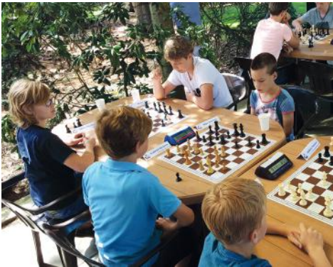
Jeugschaaktoernooi in het Pinetum

HSG Hilversum kreeg er het afgelopen jaar niet minder dan 44 nieuwe leden bij en kwam, wanneer het aantal vertrekkende leden daarvan wordt afgetrokken, op een saldo van 26 nieuwe leden. De Hilversumse vereniging was daarmee verreweg de grootste groeier op landelijk niveau. De prijs bestaat uit een geldbedrag van 1.000 euro.